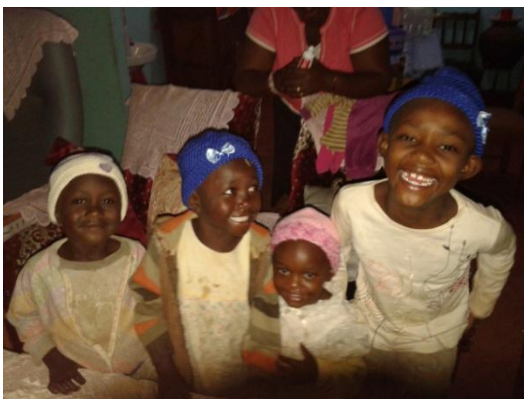
Mutsjes voor de kinderen