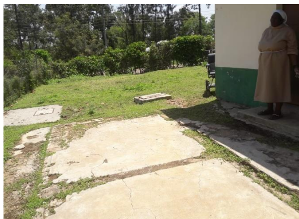
Gedeelte van de fundering

De plaats waar het huis moet komen is al bekend, namelijk achter het guesthouse.